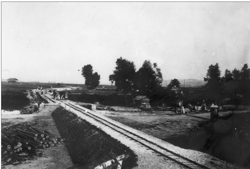
Maizy : franchissement de l'Aisne (carte postale).