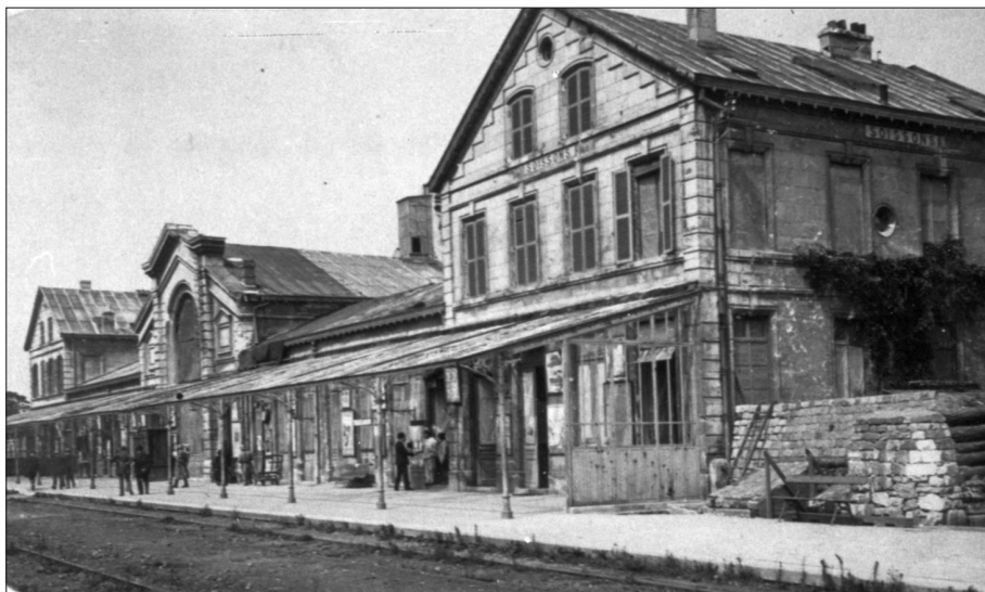
Gare de Soissons désaffectée, sans rails (carte postale).